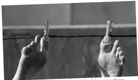
Still frame, Shirin Mohammad Washing machine 0:03:07 2012