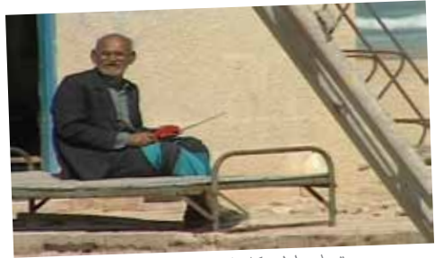
تنهایی اول، کامران شیردل، تولید ۲۰۰۲، ۱۸ دقیقه Solitude Op.1, Kamran Shirdel, 2002, 18'

Kamran Shirdel (born in 1939) studied architecture, urbanism, design and film direction at the Centro Sperimentale di