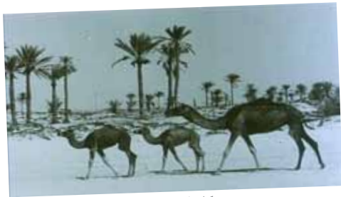
دوبی، کامران شیردل، تولید ۱۹۷۵، ۳۸ دقیقه Pearls of the Persian Gulf: Dubai , Kamran Shirdel, 1975, 38

after it was made (and censored), his The Epic of the Gorgani Village Boy ( The Night It Rained! ), after receiving the GRAN PRIX at The Third Tehran International Film Festival (1974), was immediately banned again and remained so (like his Nedamatgah ( Women's Prison , 1965), Qaleh ( Women's Quarter , 1966), Tehran Is the Capital of Iran (1966), and others) until after the revolution. His first (and, to date, only complete) feature film, The Morning of the Fourth Day (1972), a remake of Jean-Luc Godard's A bout de souffle , won a few awards at the Sepas National Film Festival. Shirdel, forbidden from pursuing his interest in observing and analyzing his society, he turned his creative and technical talent to the making of a great number of commissioned and institutional films; a fertile production of highly praised industrial and educational films. He paved the way for a type of social and critical documentary film in Iran that refused to be misused by presenting a politically documented and accurate reflection of reality. Shirdel's films are considered to be veritable references for the social documentary and filmmaking in Iran. His films have been widely shown in famous international film festivals and a series of retrospectives have been dedicated to him and his works (Moscow, Krakow, Leipzig, Florence, Paris, Lisbon,