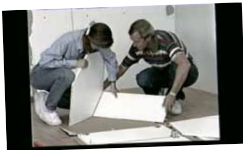
ژولی ووسبیر، نابود کردن آشپزخانه، ۲۰۰۶، ۶ دقیقه ۳۰ ثانیه Julie Vayssière, Distroy the kitchen, 2006, 06' 30"

این فرآیند ساختارشکنانه به روشهای متفاوتی چون بازیابی خاطرات دیگران (بهشت بازیافته)، داستان‌سرایی و تکنیک‌های سینمایی (مجمع‌الجزایر)، ساخت انتقادی کل کار درباره‌ی جایگاه تصویر (نه سنگریزه، نه مروارید) یا ارتباط آن با بیننده (آبیاری) و یاحتی پروتکل ساده‌ی مونتاژ که تصاویر متحرک و به تبع آن مفهوم را ساختارزدایی می‌کند (نابود کردن آشپزخانه) بوجود آمده‌است.