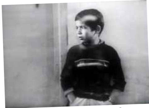
زنگ تفریح، عباس کیارستمی، تولید ۱۹۷۲، ۱۴ دقیقه The Break Time, Abbas Kiarostami, 1972, 14'

سایه‌های بلند باد بر اساس داستان کوتاه چهار صفحه‌ای از هوشنگ گلشیری است که مشترکاً به فیلم‌نامه‌ای ۸۵ صفحه‌ای بدل شد. این داستان در باره‌ی ساخت یک مترسک در روستا است و اینکه چطور از خلال برخی رویدادها و خرافات مترسک نمادی مقدس می‌شود. فیلم، شمشیری دو لبه در برابر ظلم (حکومت استبدادی) است و اینکه چطور نمادهای ماورالطبیعه توسط مردم خلق می‌شوند و اینکه چطور مردم تحت سلطه‌ی مخلوق خود قرار می‌گیرند. فیلم قبل و بعد از انقلاب توقیف بود. پس از انقلاب این فیلم فرصت یافت برای سه روزبه نمایش در آید.