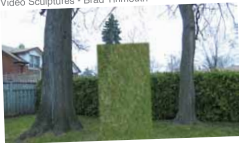
ویدیو مجسمه‌ها - براد تیمموس Video Sculptures - Brad Tinmouth

be viewed on the Internet. In this selection some artworks raise questions around the effects which documentations have on production of art: the final art product. Some others address the impact of today's popular online art dissemination on the art creation.