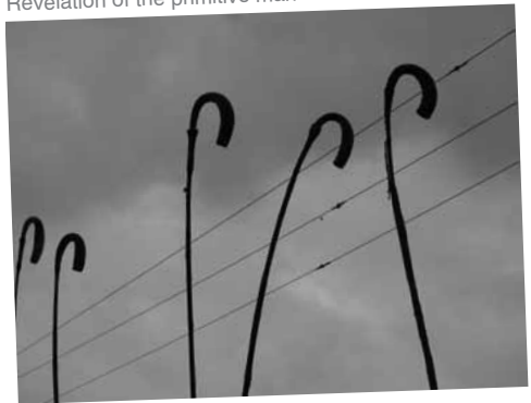
هیوط انسان بدوی Revelation of the primitive man