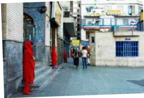
بانوی سرخ‌پوش آخرین روز اجرا Lady in red , Last day of performance

تنش معتبر اجرایی از داوود زارع است که در ماه آذر و دی ۱۳۹۱ به انجام رسیده است. این اجرا، پژوهشی بر طراحی حرکت و رقص در رقص معاصر است. صرف عمل غذا نخوردن، عمیقاً بر سطوح مختلف زندگی اجرا گر تاثیر خواهد داشت از فیزیک او گرفته تا رفتار عاطفی و جسمانی، تفکراتش و ادراکش از زمان. بنابراین اجراگر به طور همزمان از سوپی کنشگر و سوژه‌ی اجرا و از سوی دیگر ابژه‌ی مقتضیات فرایند اجراست. مخاطبان در حین اجرا قادرند زندگی روزمره‌ی اجراگر را از ابتدا از طریق وب سایت پروژه دنبال کنند و شاهد تغییرات و اتفاقاتی که در این بازه‌ی زمانی رخ می‌دهد باشند.