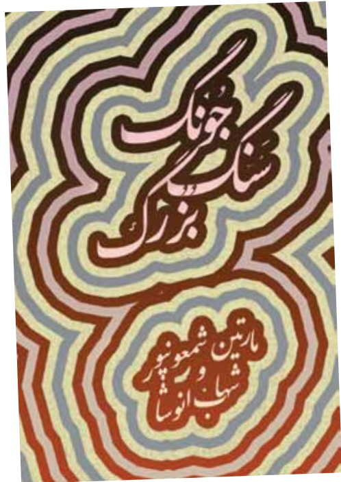
Poster The big stone show