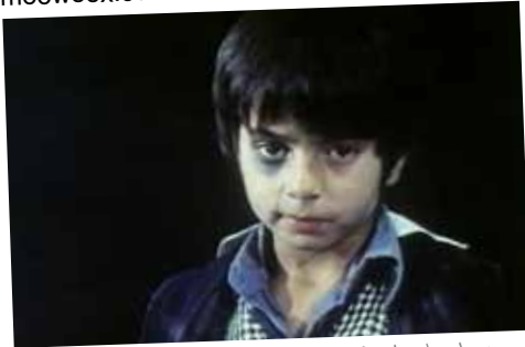
دو راه حل برای یک مسئله، عباس کیارستمی، ۱۹۷۵، ۴ دقیقه Two Solutions For One Problem, Abbas Kiarostami, 1975, 4'

films and video screening programmed by mooweex.com and Parkingallery's Archive